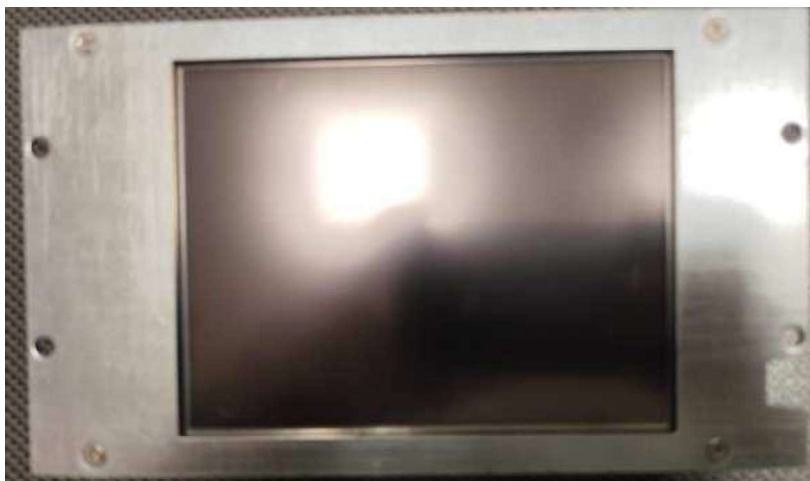
Figura 2: Lado frontal do display do controlador

POL-EKO® A.Polok-Kowalska sp.k. 44-300 Wodzisław Śląski ul. Kokoszycka 172 C